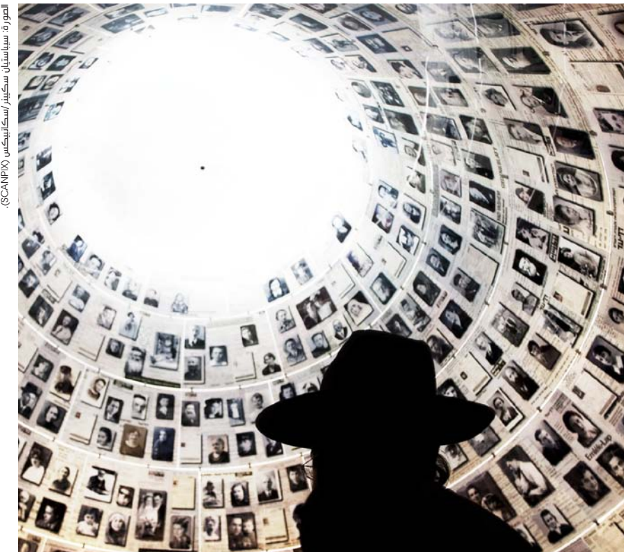
قاعة الأسماء في ذكرى المحرقة ياد فاشيم في القدس.

للتحقيق في نشاطات منظومة السياسة الخارجية للسويد فيما يختص بقضية راؤول فالينبيرج. وفي عام 2003، صدر تقرير لخصت فيه التحركات السياسية السويدية تحت عنوان «فشل دبلوماسي».