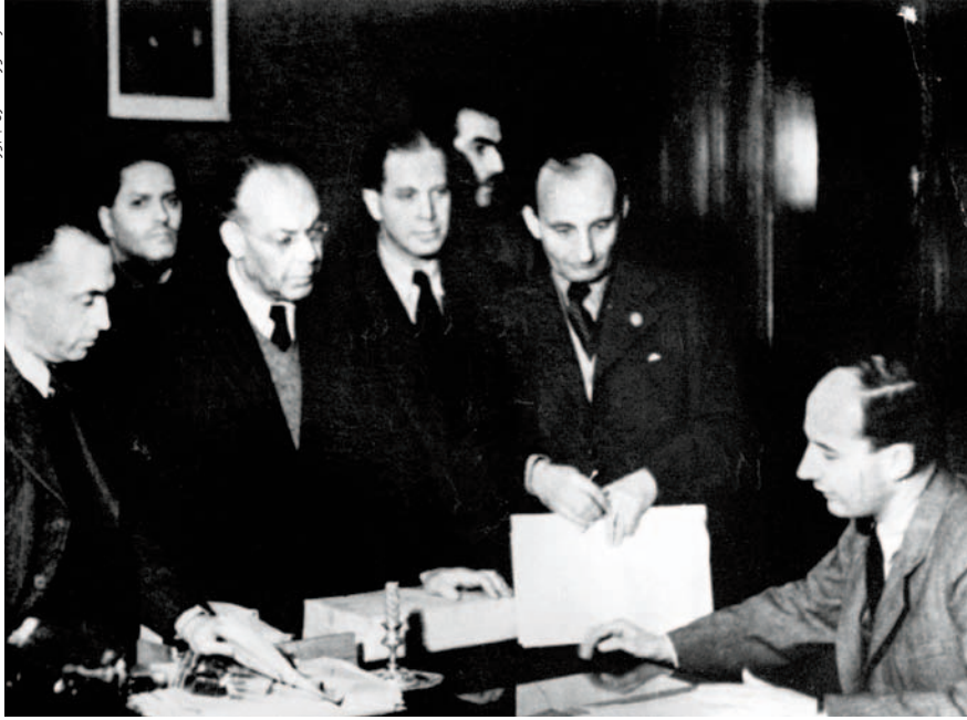
راؤول فالينبيرج (إلى اليمين) يحيط به زملاؤه في بودابست في عام 1944.