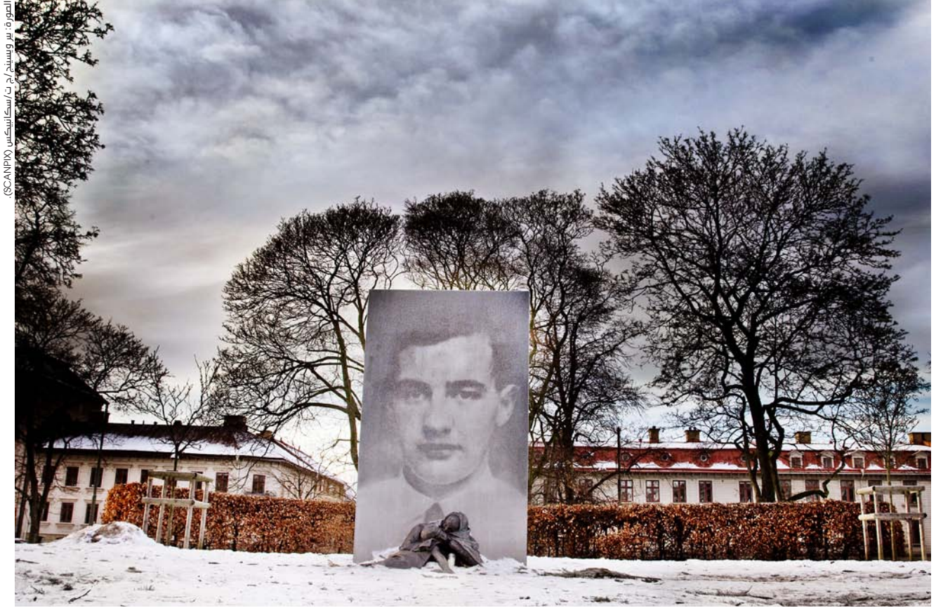
إن إبداع شارلوت جيلينهامار في غوتبورغ هو واحد من عدة معالم أثرية لراؤول فالينبيرج حول العالم.