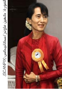
أونج سان سو كاي، الفائزة بميدالية فالينبيرج في عام 2011.

إن ميدالية فالينبيرج هي جائزة أمريكية للمجهودات الإنسانية. وتمنح منذ عام 1990 بهبة فالينبيرج من جامعة ميتشيفان للمجهودات الإنسانية غير العادية. وعلى