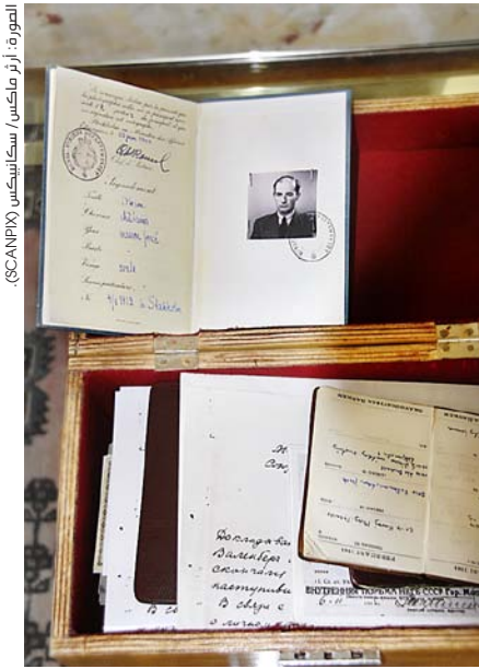
سلمت الممتلكات الشخصية لفالينبيرج بالاتحاد السوفيتي السابق في عام 1989.

عينت الحكومة السويدية في أكتوبر 2001 لجنة تحقيق رسمية «لجنة إلياسون» (Eliasson Commission)